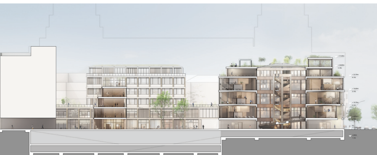
Schnitt durch die Höfe