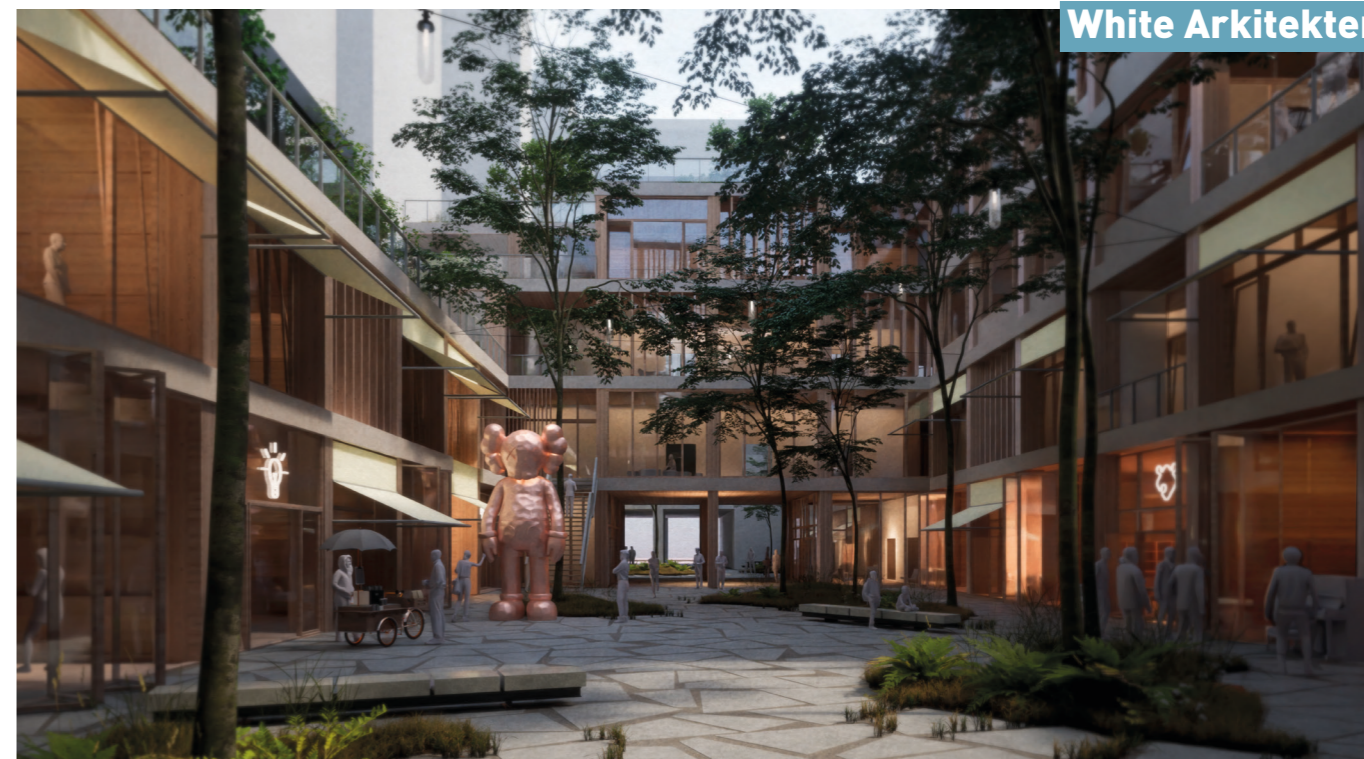
Blick in die Hoffolge Richtung Hasenheide