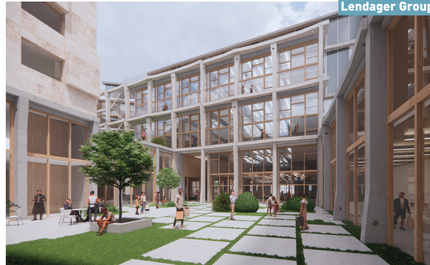
Blick in die Hoffolge Richtung Urbanstraße