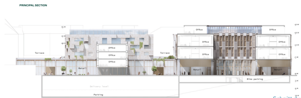
Schnitt durch die Höfe